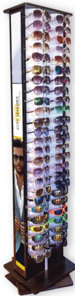
100 PIECE DISPLAY 14 1/2" W x 70 1/2" H | Code: 441D