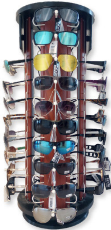
40 PIECE COUNTER DISPLAY 16 1/4" W X 29 1/4" H | Code: 440D