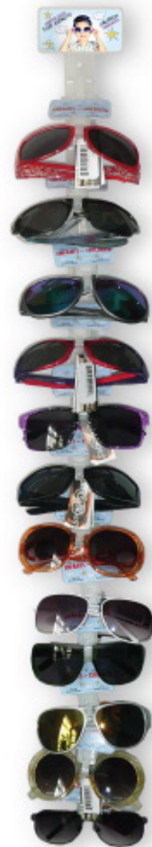
FREE CLIP-STRIP WITH PURCHASE OF 12 CHILDREN SUNGLASSES

UNIQUE UPC CODE FOR ALL ADULT SUNGLASSES: 847589007620