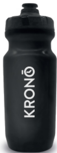
BLACK / NOIR