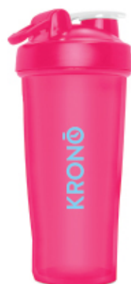
BERRIES / BAIES