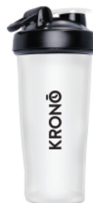
CLEAR / CLAIR