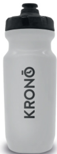
WHITE / BLANC