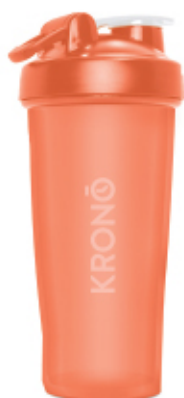
PEACH / PÊCHE