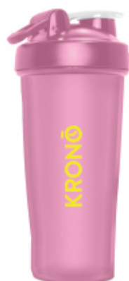
LIMONADE / LIMONADE