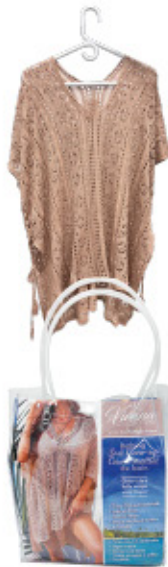
BEIGE SAHARA / VF-SWCOV103 847589041280 / PQT (4)