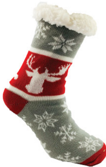
VF-SK02 / 847589030659 Gris et rouge

DOUBLURE EN MOLLETON, 100% POLYESTER ET DOUBLURE 100% ACRYLIQUE