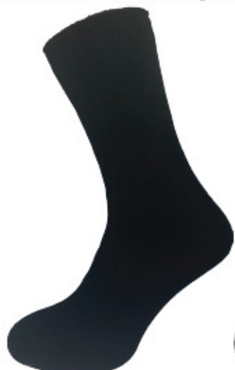
VF-TSK-W09 / Noir 847589036019

97% ACRYLIQUE / 3% ÉLASTHANNE, PROTECTION CONRE LE FROID JUSQU'À -25°C, TAILLE UNIQUE