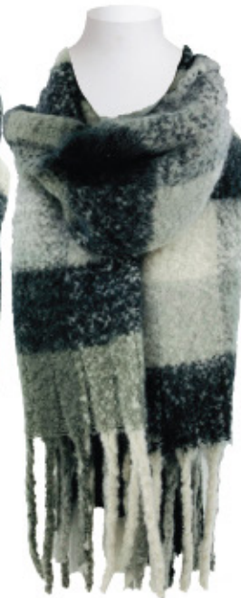
VF-SCF-W05 847589030499 Gris & noir