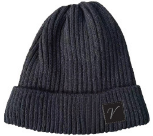
VF-TQ-M02 / 847589030383 Noir