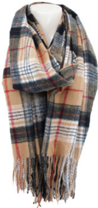
VF-SCF-W01 847589025013 / Beige

AUSSI DOUX QUE DU CACHEMIRE, 100% POLYESTER