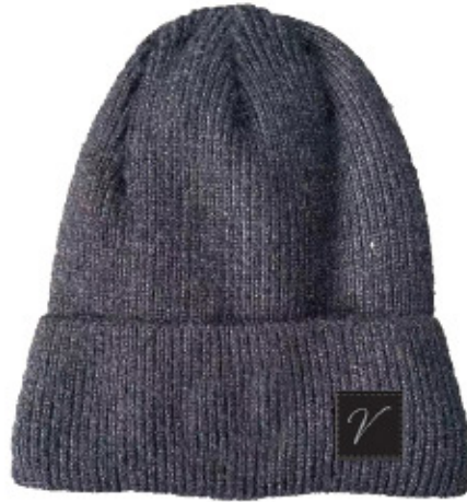
VF-TQ-M01 / 847589030376 Gris foncé