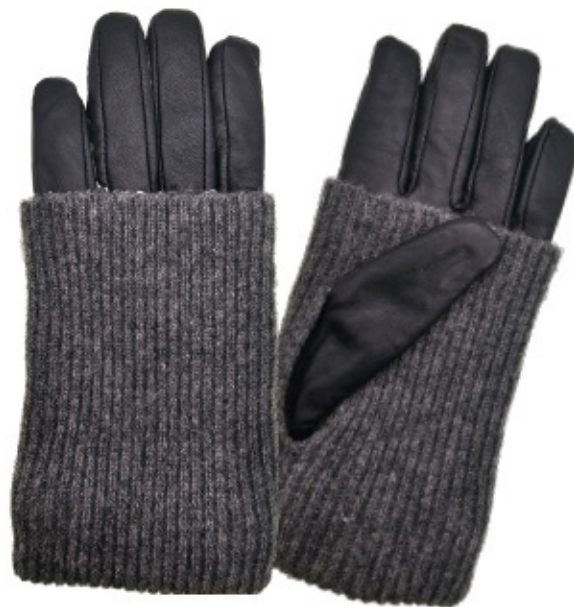
Gants noirs avec index tactiles VL-GL-W10 / 847589055256