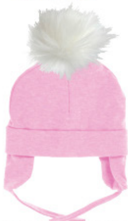
VF-TQ-BB02 / 847589030406 Bébé fille - Rose pâle