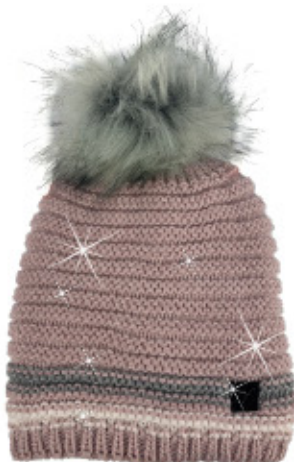
VF-TQ-W08 / 847589036118 / ROSE