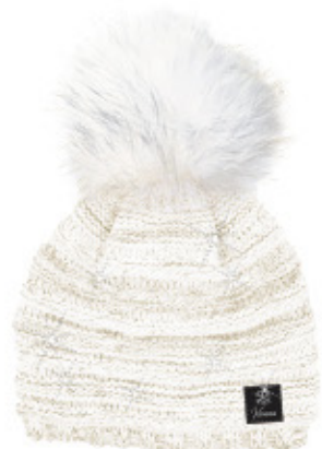
VF-TQ-W07 / 847589036101 Blanc