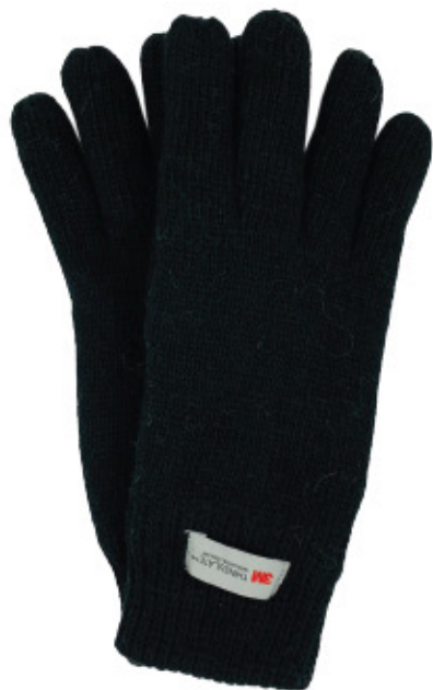
VF-GL-M01 847589030543 Noir