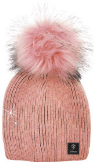
VF-TQ-W03 / 847589030307 Rose pâle

AVEC POMPON ET BRILLANTS, BRILLENT LORSQU'ON LES ÉTIRE, TAILLE UNIQUE