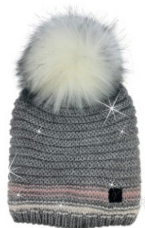
VF-TQ-W09 / 847589036125 / GRIS