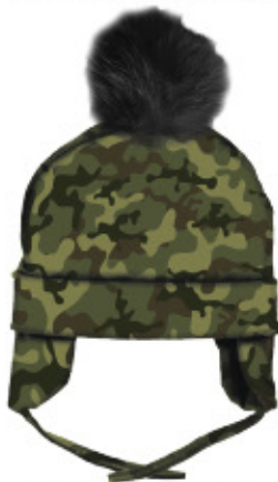
VF-TQ-BB05 / 847589030437 Bébé garçon - Camo vert