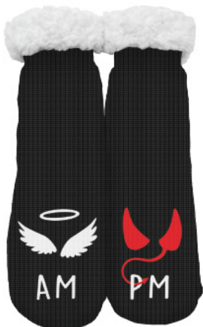
VF-FUNS05 / 847589035975 AM : ANGE - PM : DÉMON NOIR