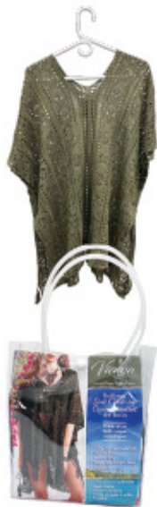
VERT CYPRÈS / VF-SWCOV102 847589041273 / PQT (4)