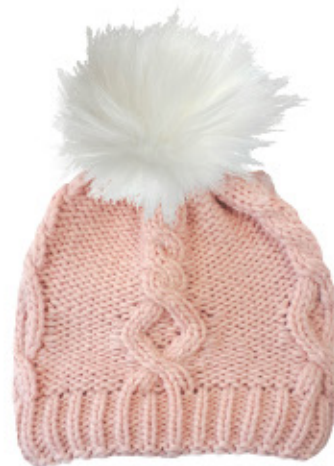
VF-TQ-W10 / 847589036132 / ROSE