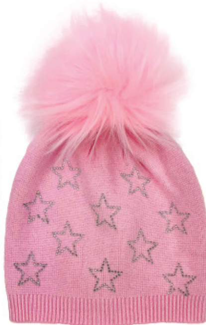
VF-KID-TQ04 847589030338 Rose avec étoiles