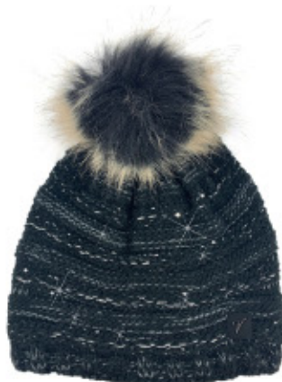
VF-TQ-W06 / 847589036095 Noir