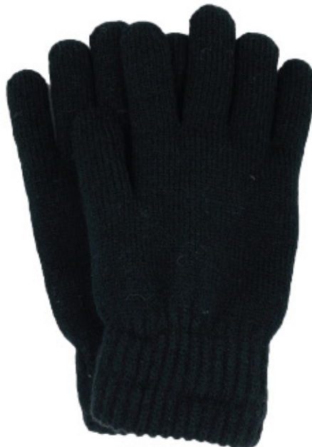
VF-GL-M04 847589030635 Noir