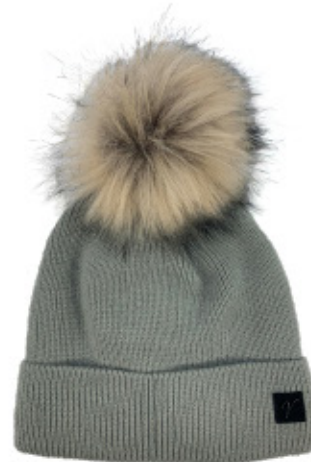
VF-TQ-W13 / 847589036163 / GRIS