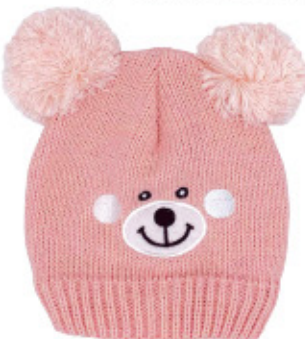
VF-TQNK-004 / 847589031243 / ROSE