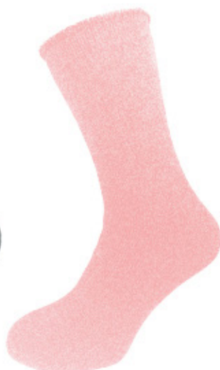
V-TSK-W11 / Rose 847589036033