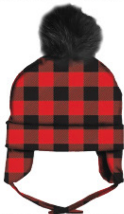
VF-TQ-BB04 / 847589030420 Bébé garçon - Noir & rouge