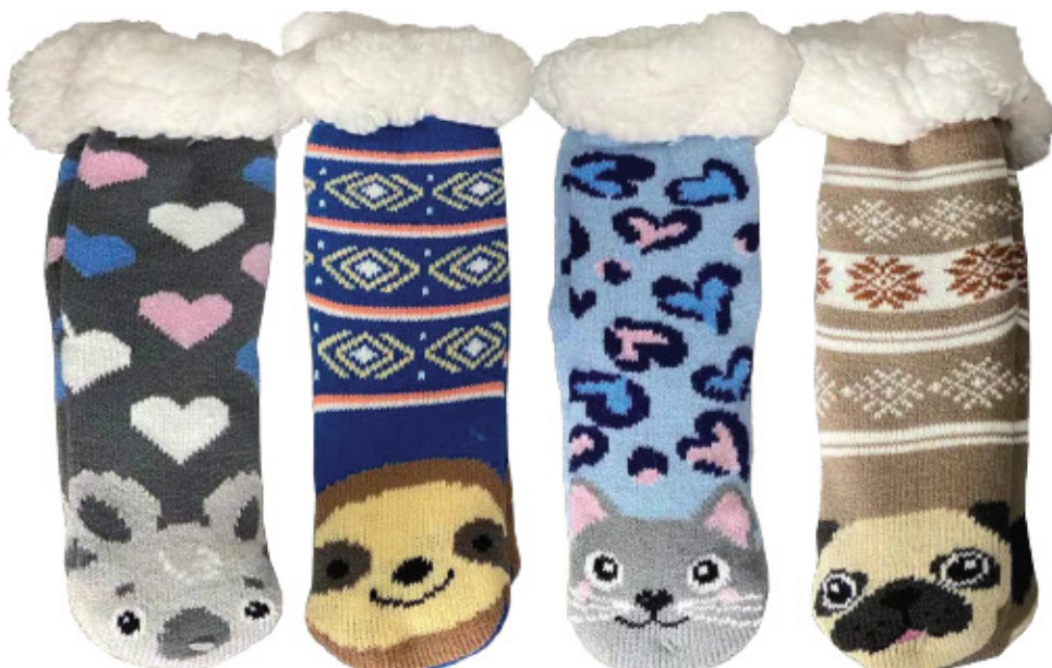
VF-KID-SK08 847589031281 MOTIF KOALA AVEC CŒURS / GRIS