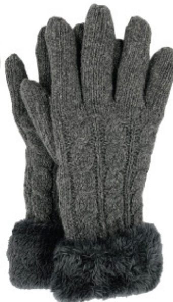
VF-GL-W07 / 847589030604 Gris foncé