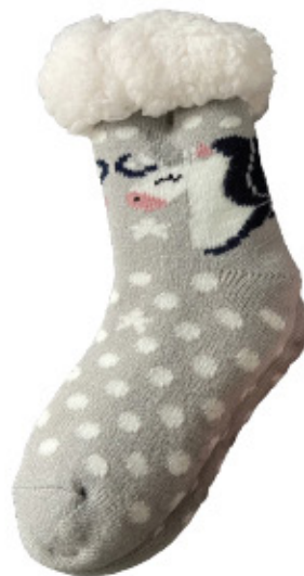
VF-KID-SK07 847589031274 MOTIF LICORNE MAGIQUE GRIS