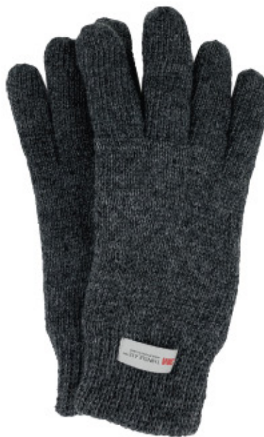
VF-GL-M02 847589030550 Gris foncé