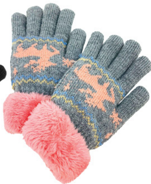
VF-KID-GL02 847589025051 / Gris et rose