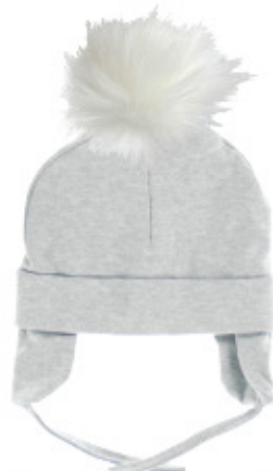
VF-TQ-BB03 / 847589030413 Bébé fille - Blanc