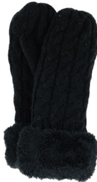
VF-MT-W05 / 847589030581 Noir