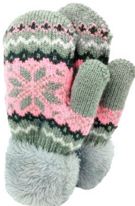
VF-KID-MIT02 847589025075 / Gris et rose