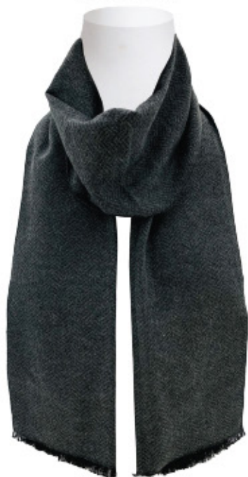
VF-SCF-M06 847589035944 Charbon 180 X 30 CM