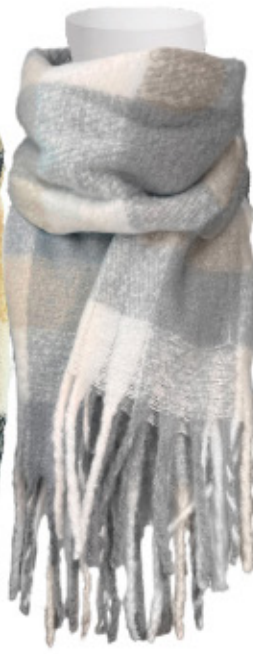
VF-SCF-W14 847589043260 Gris pâle

FOULARDS EN MOLLETON / 185 H X 42.5 L CM