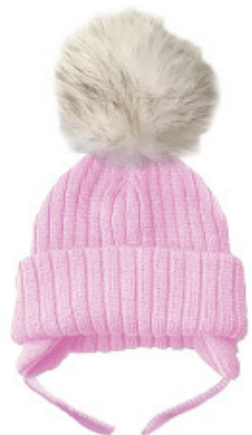
VF-TQ-BB07 / 847589030451 Bébé fille - Rose pâle