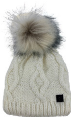
VF-TQ-W11 / 847589036149 / BLANC