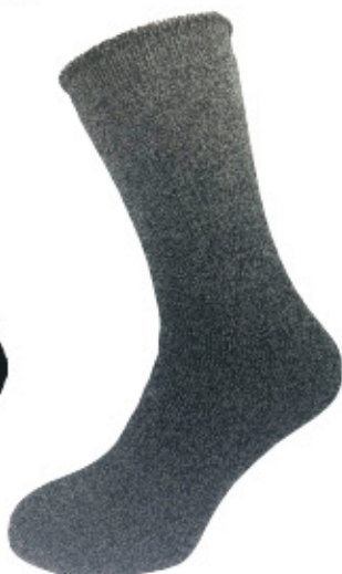
VF-TSK-W10 / Gris 847589036026