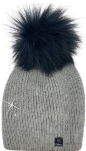
VF-TQ-W04 / 847589030314 Gris