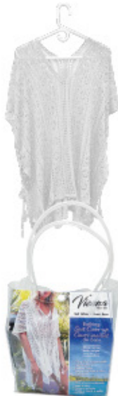
BLANC DOUX / VF-SWCOV101 847589041266 / PQT (4)