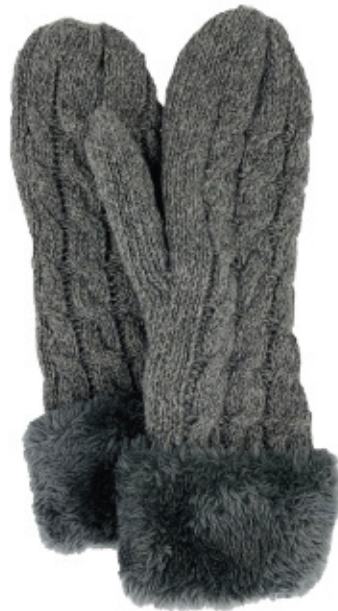
VF-MT-W04 / 847589030574 Gris foncé

AVEC POIGNET EN MOLLETON, 100% POLYESTER ET DOUBLURE 100% ACRYLIQUE