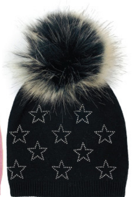
VF-KID-TQ05 847589030345 Noir avec étoiles