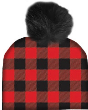
VF-KID-TQ11 / 847589031540 Carreaux rouges et noirs, pompon noir