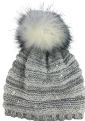
VF-TQ-W02 / 847589030291 Gris et blanc