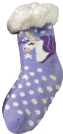
VF-KID-SK06 847589031267 MOTIF LICORNE MAGIQUE MAUVE

DOUBLURE EN MOLLETON, 100% POLYESTER ET DOUBLURE 100% ACRYLIQUE, TAILLE UNIQUE