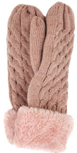
VF-MT-W03 / 847589030567 Rose pâle