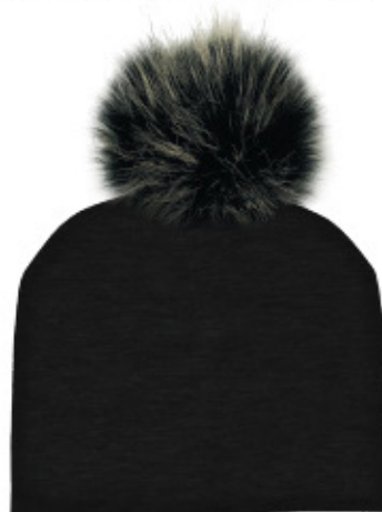
VF-KID-TQ13 / 847589031564 Noir, pompon noir