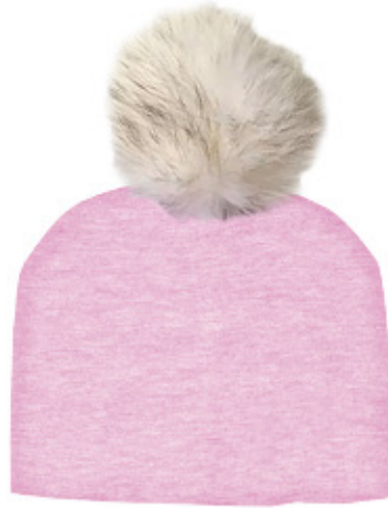
VF-KID-TQ09 / 847589031526 Rose pâle, pompon blanc