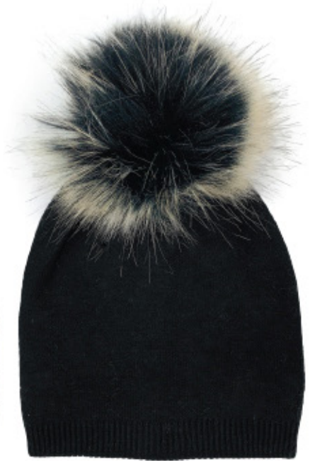
VF-KID-TQ07 847589030369 Noir avec pompon noir et brun