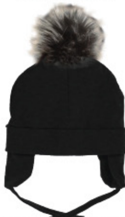
VF-TQ-BB06 / 847589030444 Bébé garçon - Noir