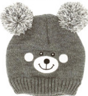
VF-TQNK-003 / 847589031236 / GRIS