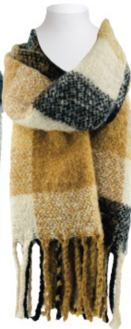
VF-SCF-W06 847589030505 Beige, blanc & noir