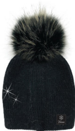
VF-TQ-W05 / 847589030321 Noir