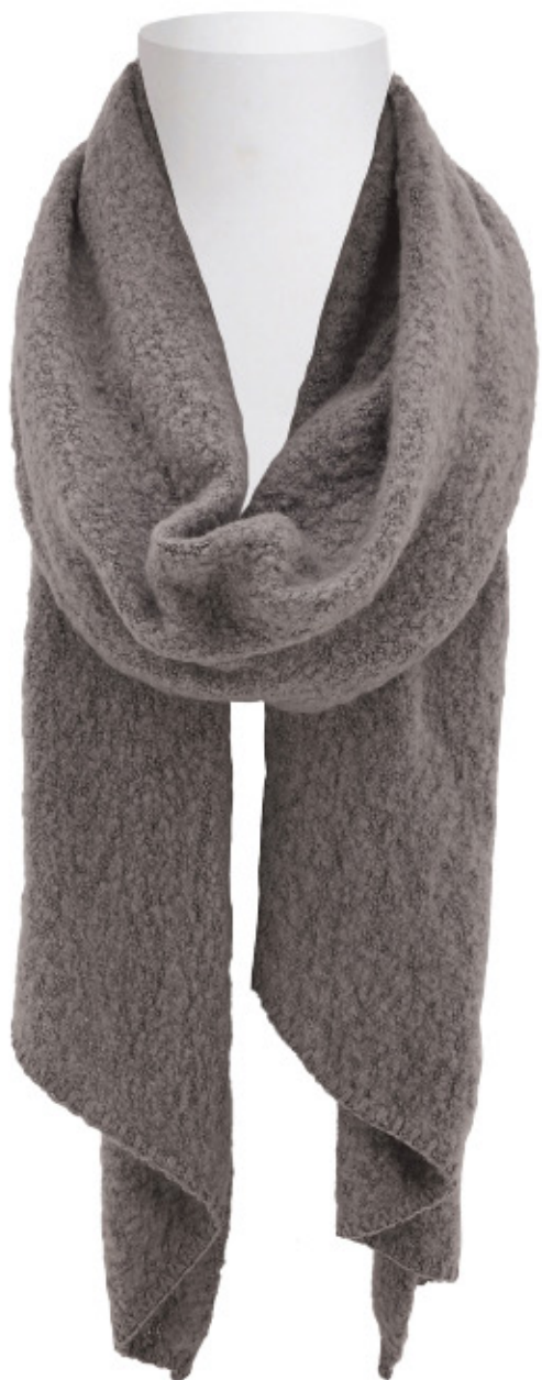
VF-SCF-W11 847589035913 Gris

ULTRA-DOUX, TENDANCE MODE, 100% POLYESTER