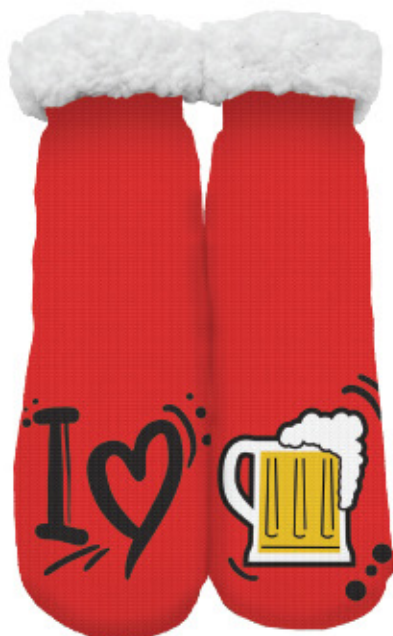
VF-FUNS06 / 847589035982 J'AI ME LA BIÈRE ROUGE