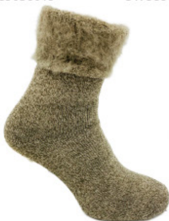
G/TG - VF-TSK-W05 / gris 847589025549 (3 mcx)