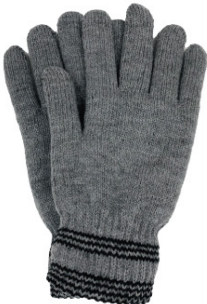
VF-GL-M03 847589030628 Gris