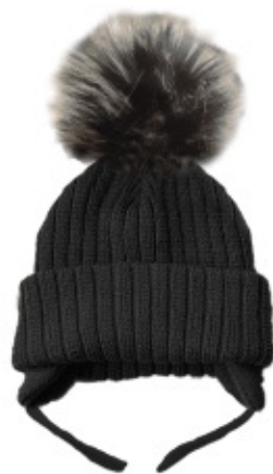
VF-TQ-BB09 / 847589030475 Bébé (unisex) - Noir