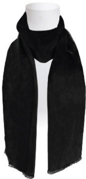
VF-SCF-M04 847589030703 Noir 170 X 30 CM

AUSSI DOUX QUE DU CACHEMIRE, 65% ACRYLIQUE, 35% VISCOSE