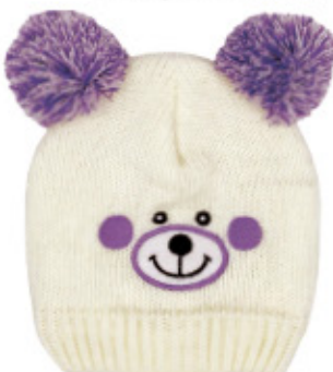
VF-TQNK-002 / 847589031229 / BLANC