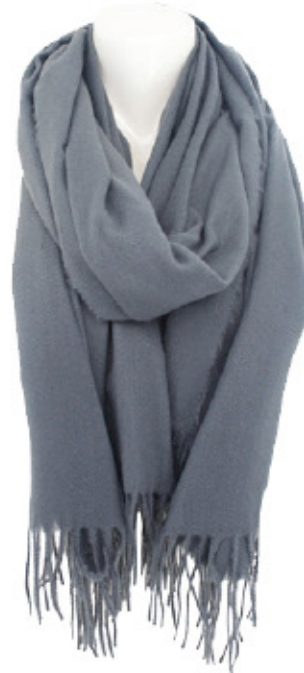
VF-SCF-W13 847589035937 Gris 180 x 60 CM