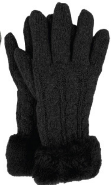
VF-GL-W08 / 847589030611 Noir