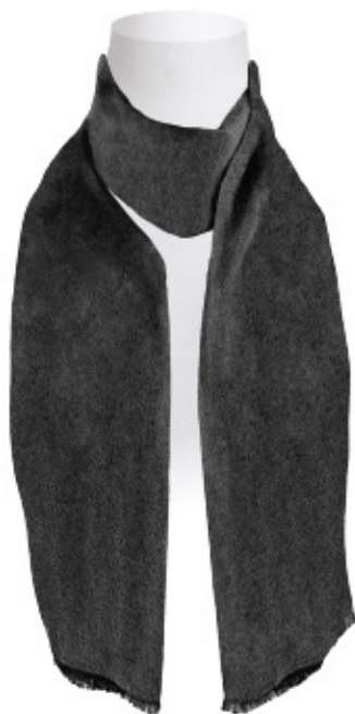
VF-SCF-M05 847589030710 Gris 170 X 30 CM