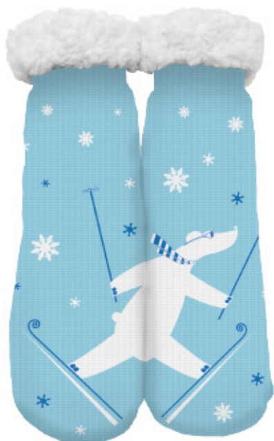
VF-FUNS03 / 847589035951 OURS POLAIRE EN SKI BLEU

DOUBLURE EN MOLLETON, 100% POLYESTER ET DOUBLURE 100% ACRYLIQUE, TAILLE UNIQUE