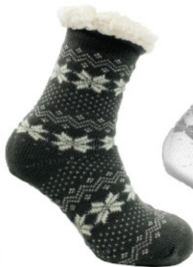
VF-SK04 847589030673 Noir & blanc