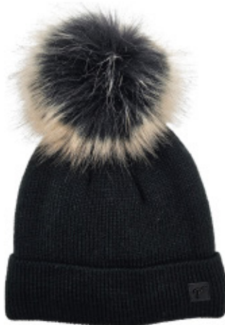
VF-TQ-W12 / 847589036156 / NOIR