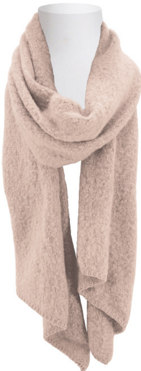
VF-SCF-W12 847589035920 Rose