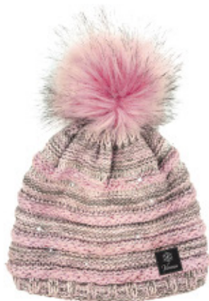
VF-TQ-W01 / 847589030284 Rose et gris