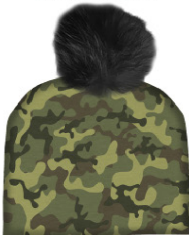
VF-KID-TQ12 / 847589031557 Camo vert, pompon noir