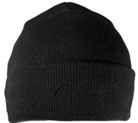
VF-TQ-200 / 847589044403 Noir