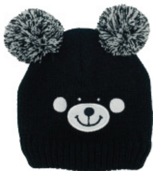
VF-TQNK-001 / 847589031212 / NOIR

DOUBLURE ULTRA-DOUCE 100% ACRYLIQUE, MOTIFS D'OURS, TAILLE UNIQUE