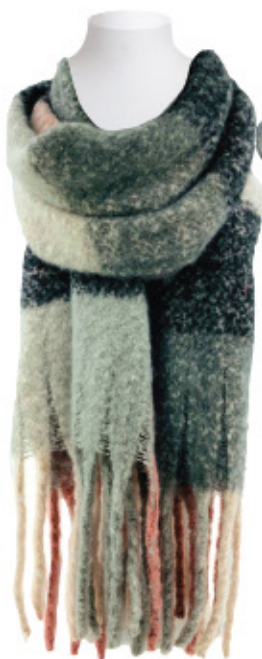
VF-SCF-W04 847589030482 Gris, noir et rose