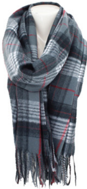
VF-SCF-W03 847589025037 / Gris