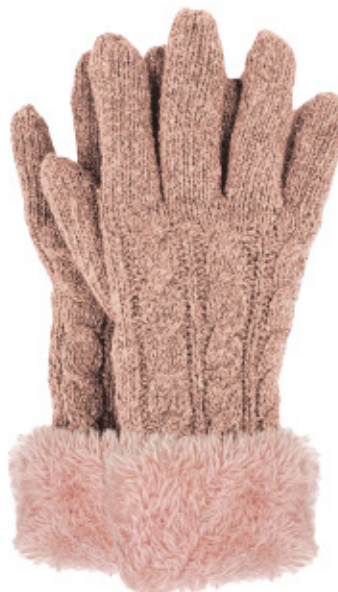
VF-GL-W06 / 847589030598 Rose pâle