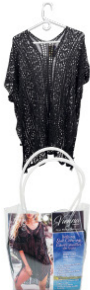
NOIR ONIX / VF-SWCOV100 847589041259 / PQT (4)