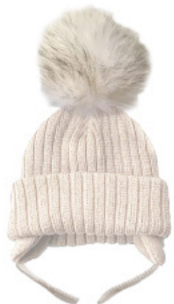
VF-TQ-BB08 / 847589030468 Bébé (unisex) - Blanc