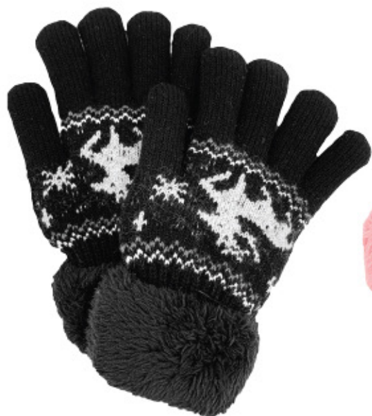
VF-KID-GL01 847589025044 / Noir et gris

100% POLYESTER ET DOUBLURE 100% ACRYLIQUE, TAILLE UNIQUE