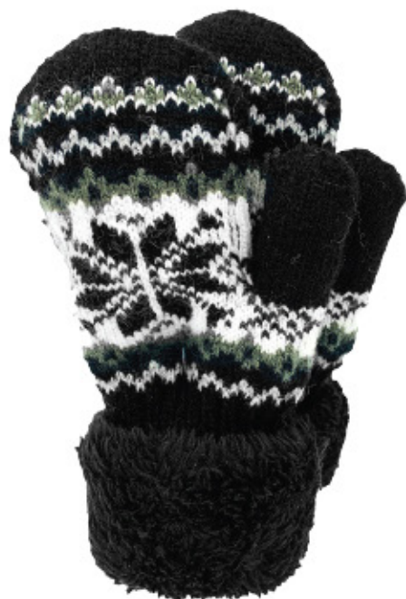
VF-KID-MIT01 847589025068 / Noir et gris