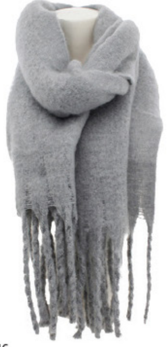
VF-SCF-WSC - 847589019746 3 couleurs assorties (noir, blanc, gris) 180 H X 45 L CM