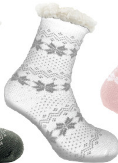
VF-SK05 847589030680 Blanc & gris pâle