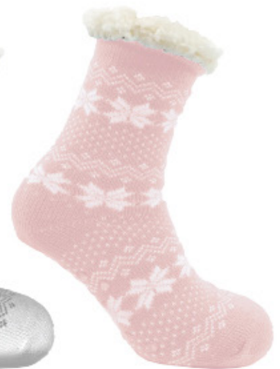
VF-SK07 847589035999 Rose pâle