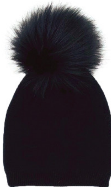
VF-KID-TQ06 847589030352 Noir avec pompon noir