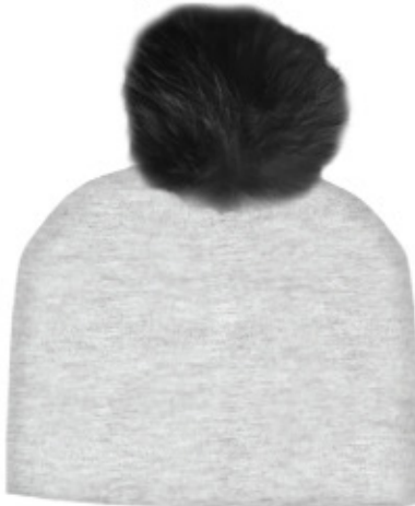
VF-KID-TQ10 / 847589031533 Blanc, pompon noir