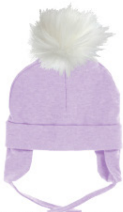
VF-TQ-BB01 / 847589030390 Bébé fille - Mauve pâle