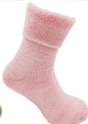
G/TG - VF-TSK-W06 / rose 847589025556 (3 mcx)

CHAUSSETTES ANTI-DÉRAPANTES - TAILLE UNIQUE