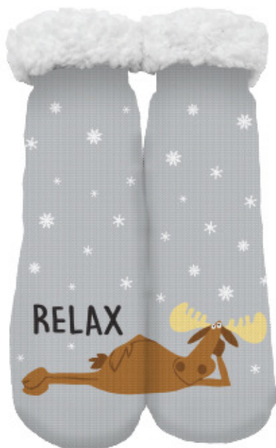
VF-FUNS04 / 847589035968 RELAX (PAS DE WIFI) GRIS