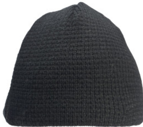
VF-BNK-M - 847589019661 Noir