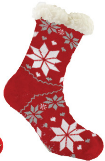
VF-SK03 / 847589030666 Rouge et blanc