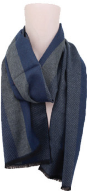
VF-SCF-M02 847589024993 Bleu 170 X 30 CM