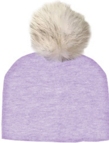
VF-KID-TQ08 / 847589031519 Mauve pâle, pompon blanc

35% COTON, 65% ACRYLIQUE, TAILLE UNIQUE, 0-5T