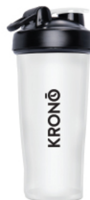
CLEAR / CLAIR