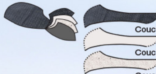
Couche évacuant l'humidité